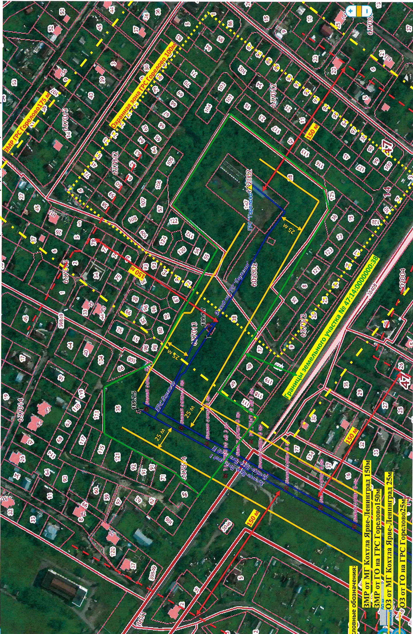
Ситуационный план земельного участка 47:14:0000000:38 относительно МГ Кохтла-Ярве-Ленинград 1,2 нитка, ГРС «Горелово»